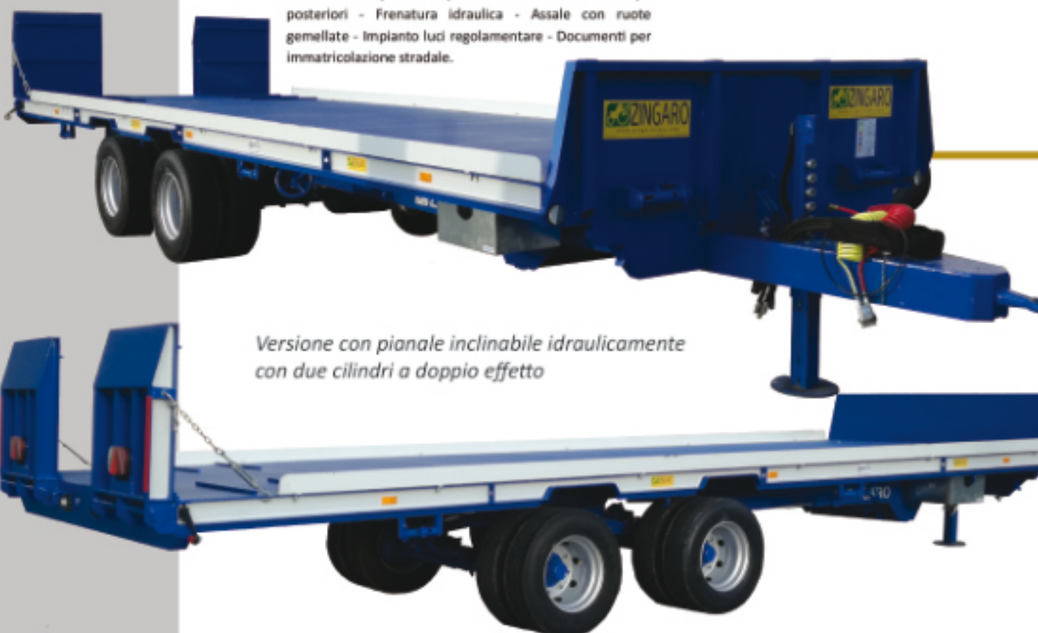
Versione con pianale inclinabile idraulicamente con due cilindri a doppio effetto

Ruota di scorta - Verricello supplementare Servo timone idraulico - Kit porta rotoballe.