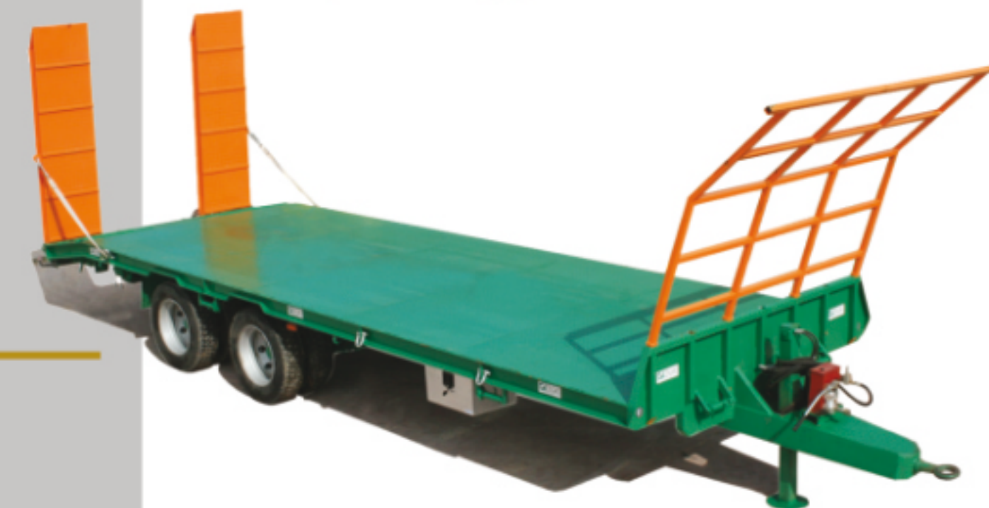
Versione con pianale fisso e rampe idrauliche